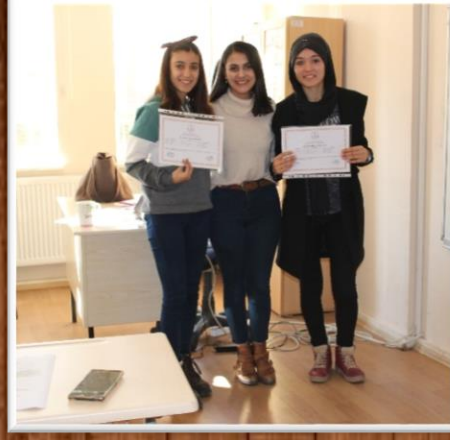
A1 İNGİLİZCE KURSU SERTİFKA DAĞITIMI