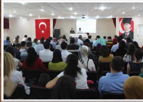
BÜTÇEMİ YÖNETEBİLİYORUM KURSU