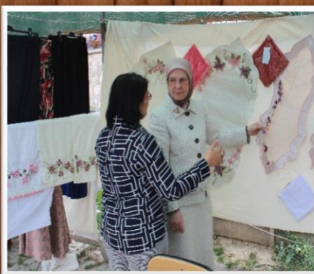
KALE HALK EĞİTİMİ MERKEZİ ÖĞRENME ŞENLİĞİ