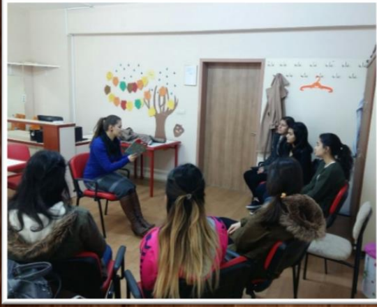
4-6 YAŞ ÇOCUK ETKİNLİKLERİ KURSU