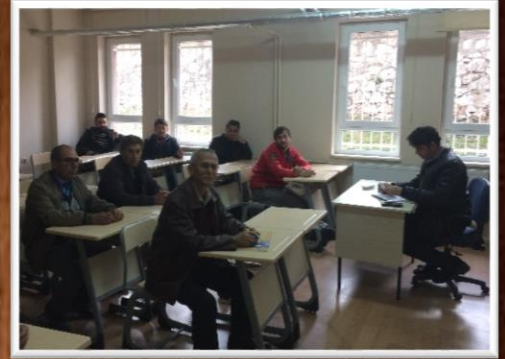
KATI ATIKLI KALORİFER ATEŞLEYİCİSİ KURSU