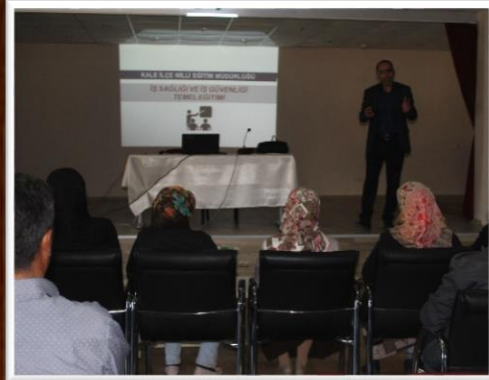
İŞ SAĞLIĞI VE İŞÇİ GÜVENLİĞİ KURSU