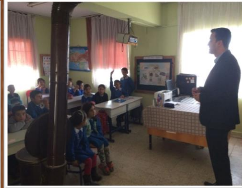
TÜRKİYE BAĞIMLILIK İLE MÜCADELE KURSU