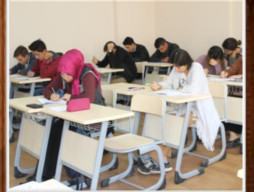
YKS HAZIRLIK KURSU