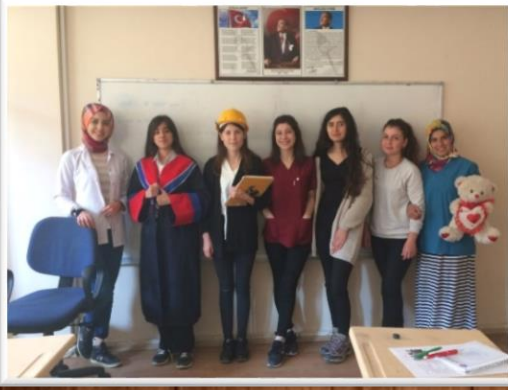
A1 İNGİLİZCE KURSU