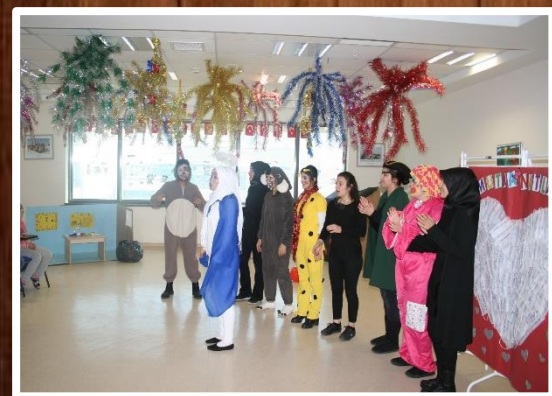
LÖSEMİLİ ÇOCUKLAR GEZİSİ