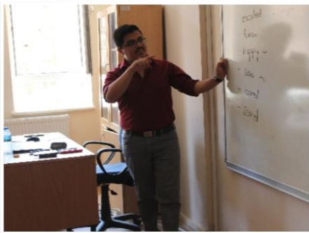
A1 İNGİLİZCE KURSU