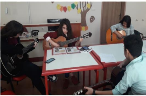
POPÜLER GİTAR KURSU