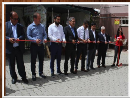
KALE HALK EĞİTİMİ MERKEZİ ÖĞRENME ŞENLİĞİ